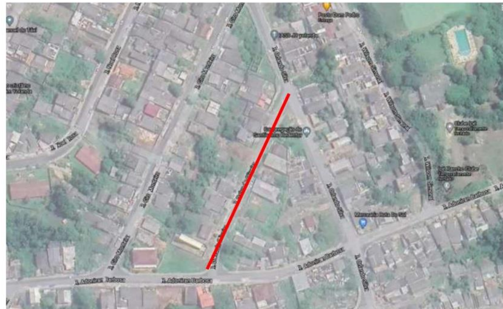
Figura 1: Fonte Google.

UTM DE LOCALIZAÇÃO: -24.283432, -47.442000